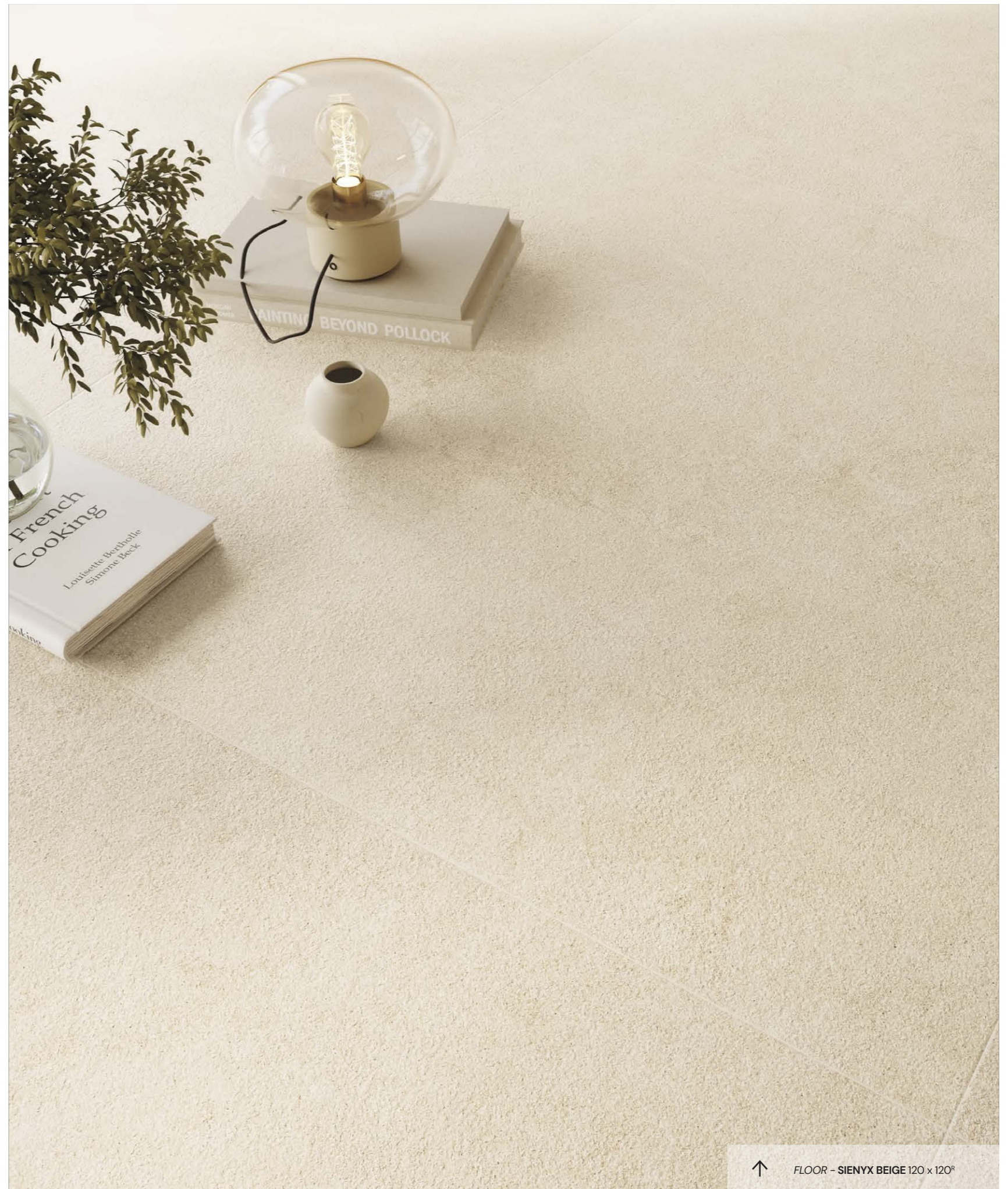
↑ FLOOR - SIENYX BEIGE 120 x 120 R

Sienyx is a collection designed for architectural spaces that seek order, balance and essential elegance. A collection that allows the material to speak.