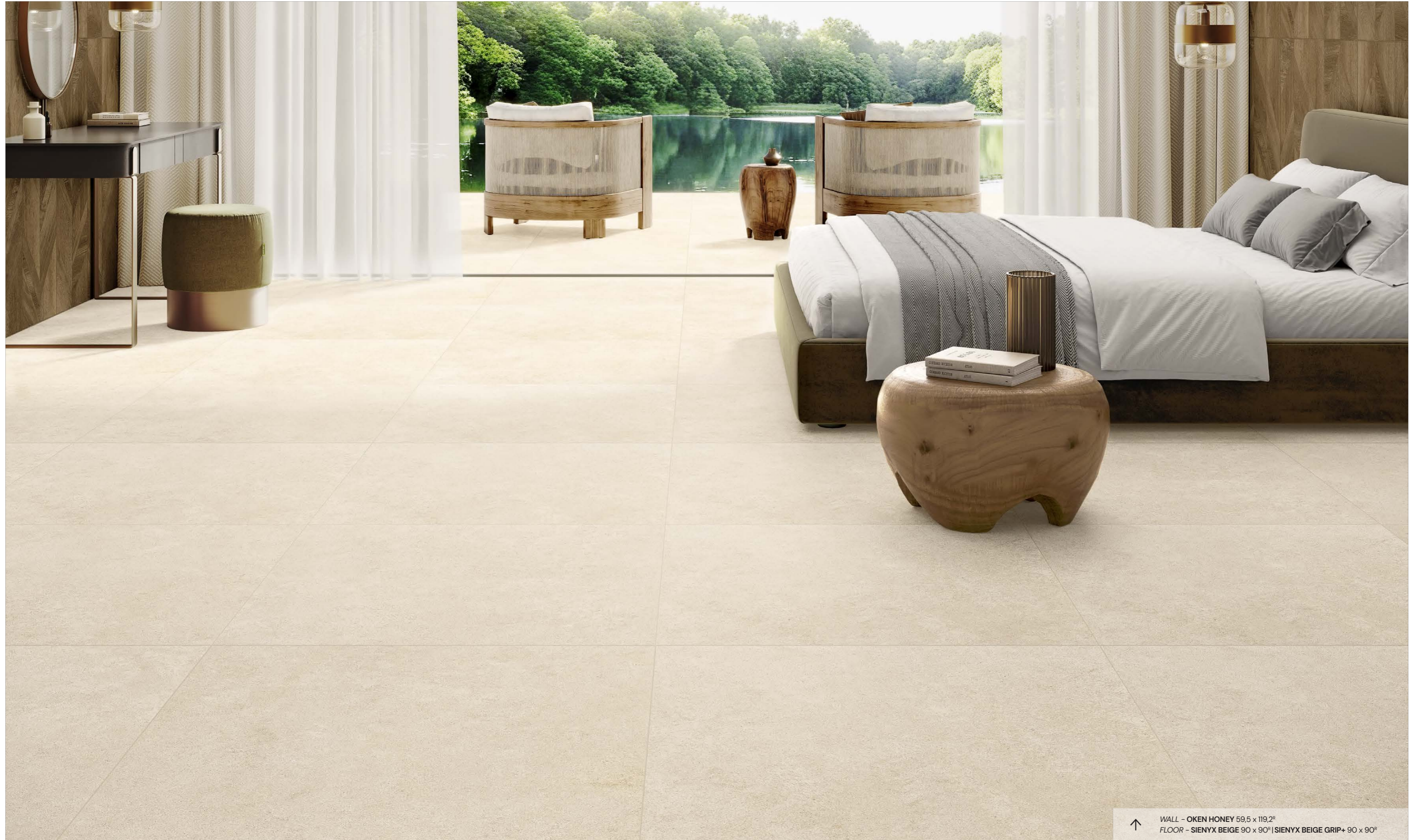
↑ WALL - OKEN HONEY 59,5 x 119,2 8 FLOOR - SIENYX BEIGE 90 x 90 8 | SIENYX BEIGE GRIP+ 90 x 90 8