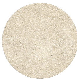
DETALLE TEXTURA TEXTURE DETAIL

Inspirada en la nobleza de la piedra Sienity Marfil de origen egipcio, la colección Sienyx captura su herencia milenaria y la traduce en una propuesta cerámica equilibrada, sobria y versátil. Su gráfica trabajada a mano con la sutileza y la elegancia de la gubia en la mano de un cantero, transmite serenidad y una belleza sin artificios.