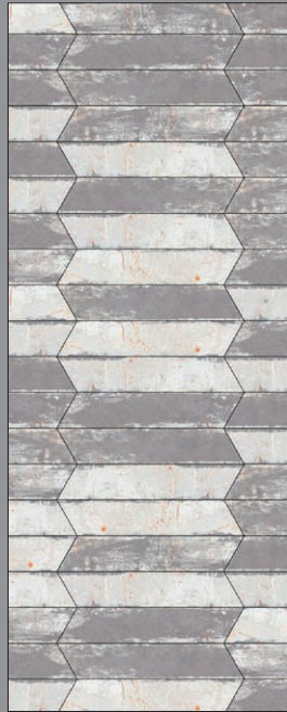
ANTHRACITE A (50%) + B (50%)