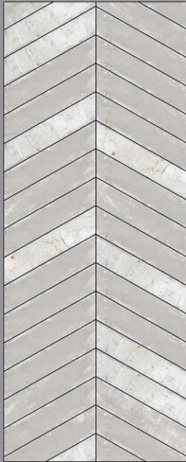
GREY A (50%) + B (50%)